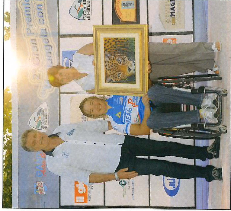
2 a Edizione "Mariangela con Noi"